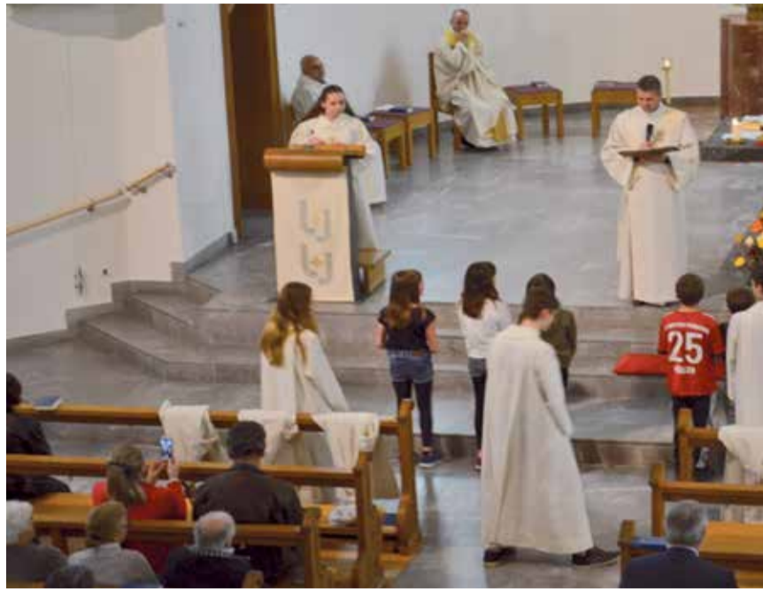
Festa della parrocchia Richterswil.

si incontrerebbero al bar, per affrontare, in modo chiaro e comprensibile, i maggiori temi che ci circondano: non vogliamo insegnare nulla, ma desideriamo stimolarci a vicenda, appassionandoci e stuzzicando la nostra curiosità di capire qualcosa di più. Finora abbiamo affrontato temi scientifici (Galileo, i vaccini, ...), di attualità (le elezioni USA, il cambiamento climatico, ...), religiosi (l'islamismo, il buddismo, ...), storici (le crociate, l'inquisizione, ...), culturali (l'Europa, i social media, ...) e folkloristici (la Festa della Mamma, il presepe, ...). Abbiamo voglia di affrontare tanti nuovi temi, ma per farlo abbiamo bisogno della vostra partecipazione e della vostra curiosità: da un lato per arricchire la discussione con le vostre idee e le vostre esperienze, e dall'altro per aiutarci a trovare dei nuovi temi da affrontare che